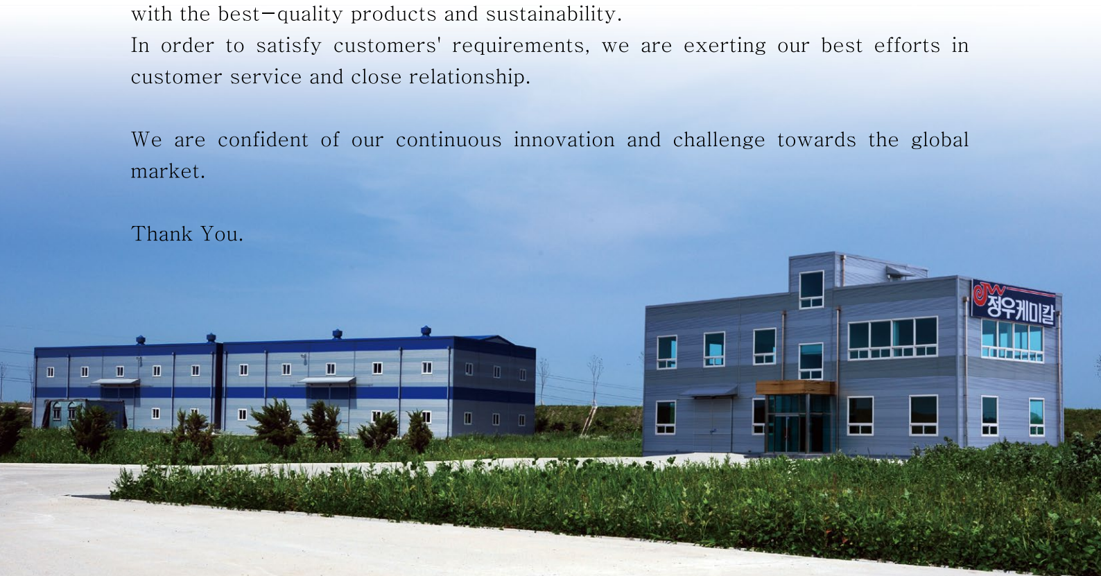
평택 공장 전경