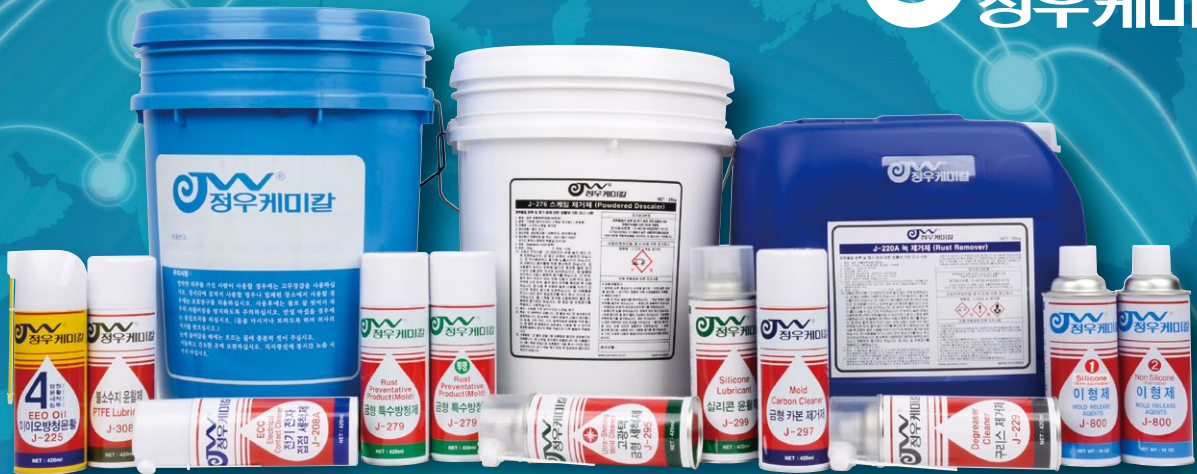
J-276 스케일 제거제